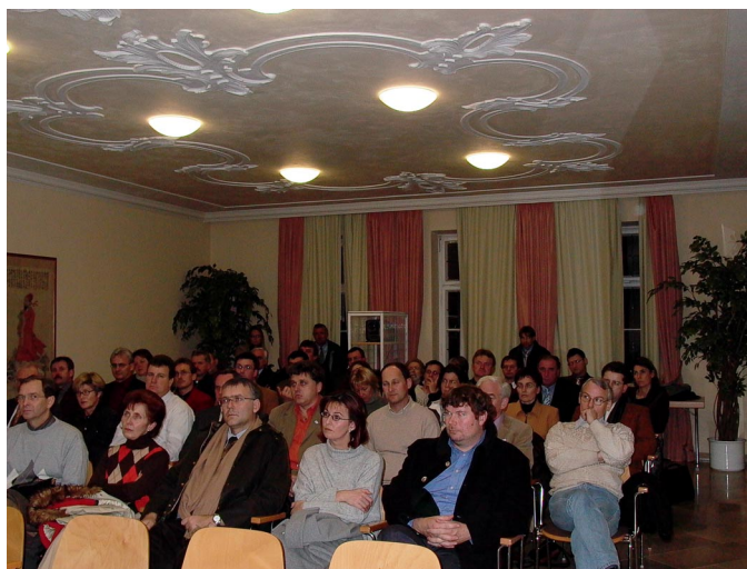
Vortrag im Qigong-Saal

Die TCM-Klinik wurde 1991 als Modell- und Erprobungsprojekt, um die medizinisch-therapeutischen Möglichkeiten und Grenzen der Traditionellen Chinesischen Medizin unter „westlichen“ und „schulmedizinischen“ Bedingungen und Gesichtspunkten in Erfahrung zu bringen. Die TCM-Klinik ist bundesweit erst- und einmalig, was auch ihre überregionale Bedeutung begründet.